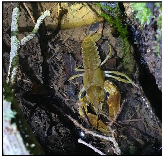
Écrevisse à pattes blanches Austropotamobius pallipes